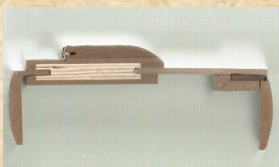
Обла каса с уширение