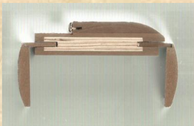
Обла каса с перваз от двете страни